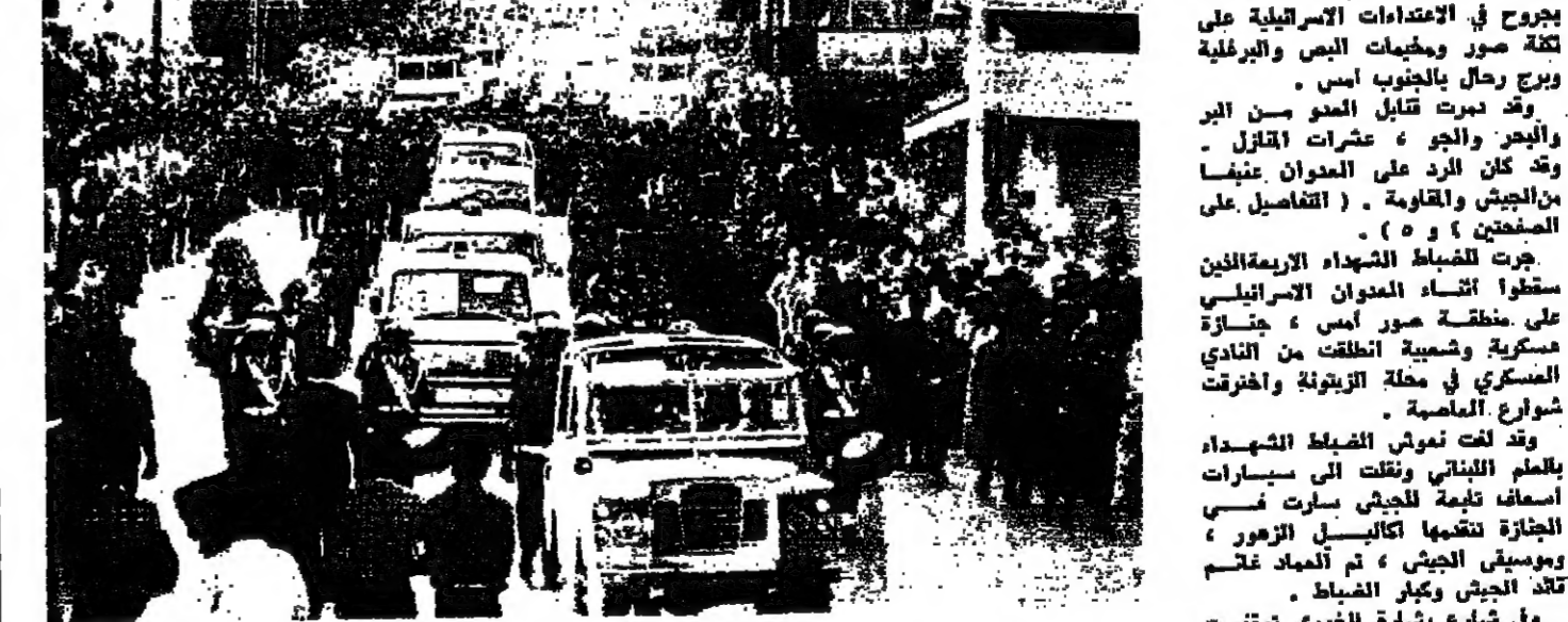
جانب من الحزبة العسكرية الشبيهة للضباط الشهداء في بيروت اميس